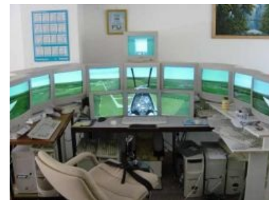
Рабочее место пациента

Из общей массы компьютерных задротов симмеры выделяются тем, что изначально детей среди них было всё-таки меньше, чем среди других геймеров . Причина проста: среднестатистическому школьнику сложно запомнить пять листов формата А4 с комбинациями клавиш, понять разницу между истинной и приборной скоростью (тангажом и углом атаки, выравниванием и выдерживанием, VOR/DME/ILS/NDB и т. д.) и уж тем более осилить 400 страниц мануала , повествующего (зачастую на английском и без картинок), как правильно обращаться с пепелцем.