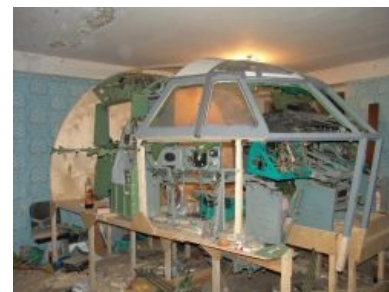
Симмер вьёт себе гнездо

Алсо, у любого уважающего себя симмера есть радиосканер, посредством которого можно слушать переговоры диспетчеров и экипажей, а также записывать их и выкладывать в сеть. Менее зажиточные поциенты проделывают всё то же самое прямо на компьютере с помощью TV-тюнера (при наличии оно)