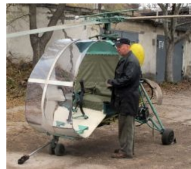
Мирный советский симмер

MicroSoft Flight Simulator X Вот так всё и происходит.