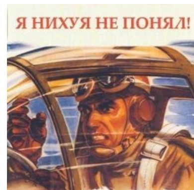
Он тоже ниасилил РЛЭ Ту-154

Вирпил + вентилятор — подвид симмера, летающий на вертолетах (обычно на боевых, так как годных моделей гражданских вертолетов —