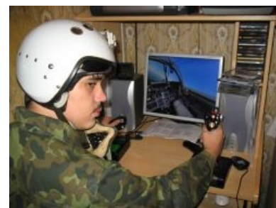
Боевой симмер смотрит на тебя как на супостата