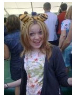
Та самая тян.