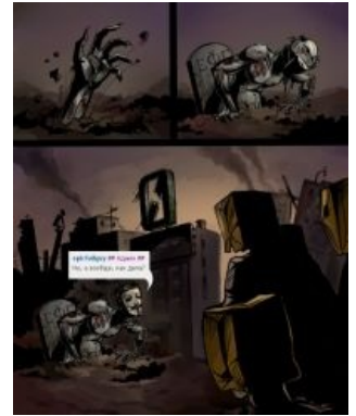
I will rise to die again!