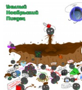
Пиздец по всей красе