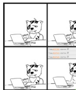
Суть™ /b/ Нульчана в 2011—2012