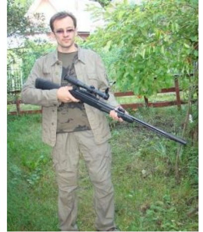
Арс смотрит на тебя как на нарушителя правил форума

Yurclub.ru (Юрclub, ЮК) — юридический сайт с форумом, блогами, собачьими свадьбами, блэкджеком и шлюхами. Создан великим и ужасным Аркадием Берещуком (он же Арс ) — программистом-недоучкой, переучившимся на юриста.