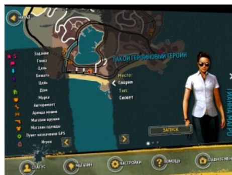
Gameloft знает толк