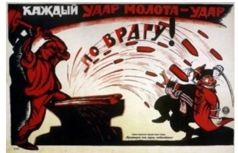
Каждый удар молота — удар!