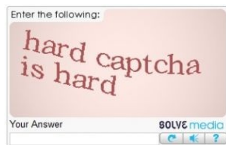
И даже капча, пойманная анонимусом