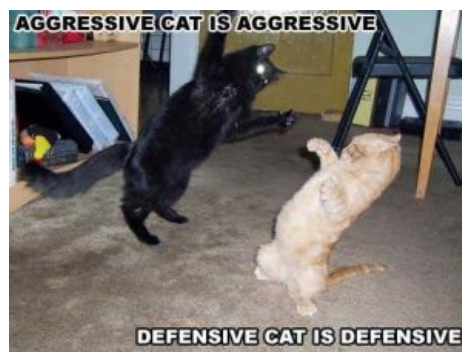
Агрессивный кот агрессивен. Защищающийся кот защищается

Отсюда рождается неверное понимание сущности конструкции: пациент уверен, что имеет дело не с подлежащим и сказуемым, а с повторением слова ради усиления («зелёный, очень зелёный»). И, соответственно, ставит запятую: «Длинный кот, такой длинный!», тем самым выдавая свой возраст и уровень образованности .