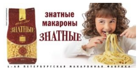
Знатные макароны знатные