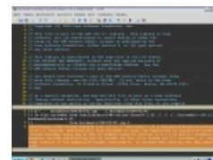
gvim в армейском линуксе