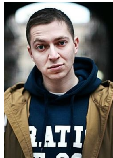
Вглядывается в струны твоей души.