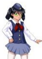
ВЛ11-тян работы художник-куна