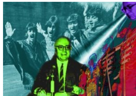
Адорно в сферическом вакууме