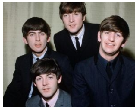
Одухотворенные лица, жи есть!

Сэр Ринго Старр (настоящее имя — Ричард Старки) — единственный няньный барабанщик, чуть менее, чем в 5% песен, — певец. Живёт в