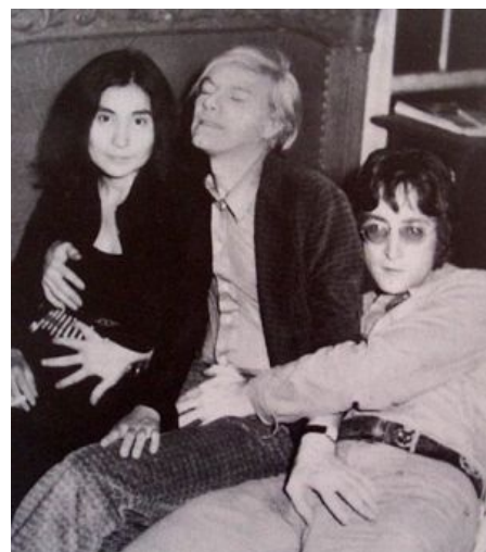
ТП, Аутист Энди и эпичный распиздяй фапают друг другу

Суть явления. Клип полон понятных любому битломану символов и намеков на события из жизни группы