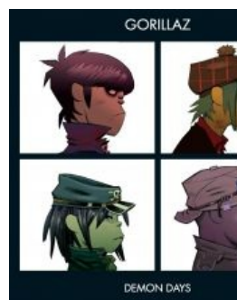
«Gorillaz» нагло косплеит