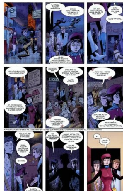
Сэр Алан Мур доставляет: «Лига выдающихся битломанов»