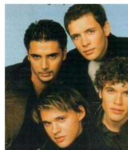
Ещё более убогая пародия — ЕРЖ-квартет «Корни»