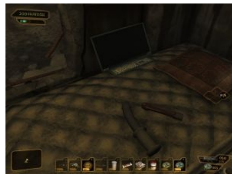
Deus Ex в теме