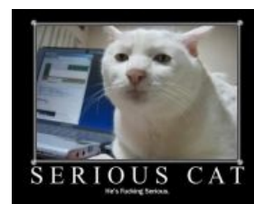
Серьёзнокот смотрит на тебя как на говно