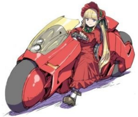
Шинку на машинке