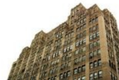
Варик-стрит, 180 - цитадель креатива