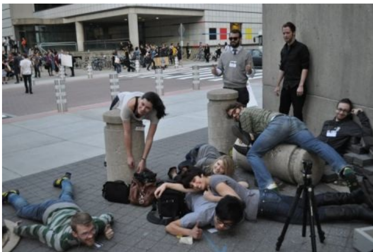
Ведущие и их помощники изображают мем "Playing Dead" на конференции Интернет-мемов ROFLCon 2010