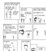
xkcd: Это Рик Эстли, детка