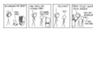
xkcd: Страшная месть!