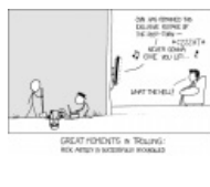
xkcd: Rick Astley rickrolled!