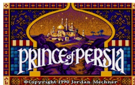
Заставка оригинальной игры

Первая трилогия Принца появилась на б-жий свет в далёком 1989 году, в эпоху платформеров , когда Джордан Мехнер (автор) решил просто так взять и сделать игру. И сделал. Через 5 лет после не менее эпичной Karateka (что характерно, там тоже надо было спасти принцессу). В игре был четырёхцветный принц, пять типов врагов, три типа ловушек, оружие, которое сначала нужно было найти и два типа окружения: подземелье и дворец. На 1989 год это было очень круто, игра сразу стала популярна и распространилась как чума, а в этой стране в эту игру продолжали массово играть ещё в 1992 году. Некоторые же олдфаги играют и поныне.