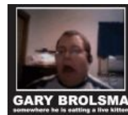
Где-то там он жрёт котов!