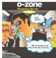
Они помогли захватить мир