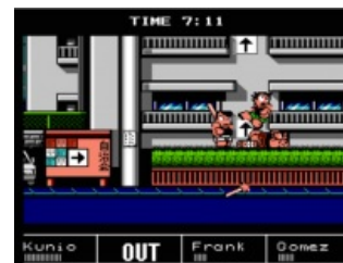
Хороший момент [1]

В Японии проводятся уличные спортивные игры, и конечно же, Кунио с друзьями никак не мог обойти это событие стороной. Игра состоит из 4-ёх уровней, на протяжении которых вам нужно будет зарабатывать очки. Если общая сумма очков больше, чем у соперников — значит вы проходите дальше. В противном случае наступает гамовер . Собсно уровни: