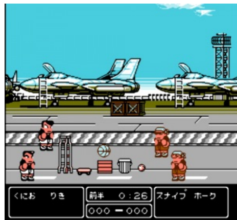
Во всеоружии (compiled)

Плюс ко всему, в этой игре очень важной составляющей успеха является погода. Ни много, ни мало, но она может кардинально