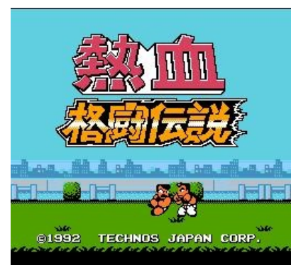
Кунио и Рики. Старые друзья опять вместе

В начале игры, необходимо создать своего персонажа. Игрок вводит имя, дату рождения и группу крови будущего бойца. Имя влияет на начальные характеристики и на используемый стиль (созданные игроком бойцы имеют разные лица, в зависимости от стиля). От даты рождения зависит набор специальных движений, а также совместимость персонажей одной команды (от знаков зодиака зависит цвет формы, а от цвета формы зависит насколько просто будет сделать Special с ботом или куном). В режиме истории за каждый выигранный бой нам присваивают уровень, и наши характеристики повышаются . Мордобои проходят на небольших локациях: холодильник , фабрика с конвейером, отвозящем слоупоков прямо к шипованной стене, электростанция с оголёнными проводами на стенах, и так далее. Бой длится до победы одной из команд. Помимо обычных супер-ударов, у каждой команды есть совместный супер-