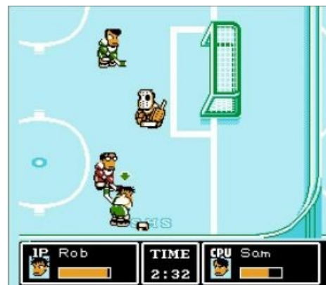
Готовимся убить вратаря