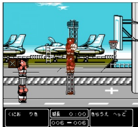
Общее представление еще одной возможности (и это не предел!)