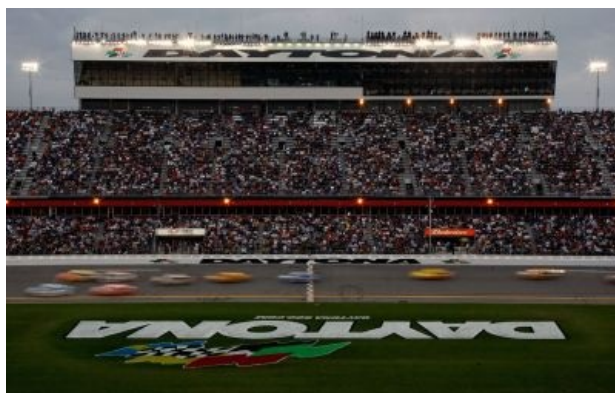
Daytona 500: классика жанра

NASCAR (ориг. National Association of Stock Car Auto Racing , немос. Non-Athletic Sport Centered Around Rednecks ) — американская автоспортивная ассоциация, проводящая NASCAR Cup Series — главный чемпионат по автогонкам с точки зрения пиндосов, известный непиндосам именно как NASCAR, а так же over9000 менее известных. Представляет собой медитативное наворачивание кругов по замкнутым автодромам и не только . Широкие слои населения напрочь не врубаются, чего же такого интересного в езде слабо похожих копий их кредитных помоек друг за другом до опиздедения, но посматривают ради эффектных аварий и общего уровня зрелищности. Менее широкие слои населения делают вид, что врубаются, и кичатся тем, что различают, какой именно команде принадлежит копия очередного улетевшего в отбойник Форд-Фьюжн. NASCAR горячо любим реднеками , проживающими в средней, южной, и особенно юго-восточной части страны. Экспортируется соседям и даже в Австралию , где реднеков тоже хватает, и где живёт своя особая традиция экстремальных автогонок (см. Mad Max ). Учитывая наличие в стране кенгуру и коал своих собственных чемпионатов, равных по статусу чемпионатам НАСКАРА, стоит отметить, что там весьма распространены холивары на тему NASCAR vs V8.