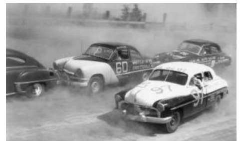
Sweet 50's — сестра «Победы» идёт на обгон

После войны, в 49-м году, ушлый малый по имени Билл Франс (он же «старший») решил-таки запилить гоночную серию с блекджеком и шлюхами, но ни одна уважающая себя автоспортивная контора не захотела связываться с тупыми реднеками и их дикими задумками, так что Франс, не мудрствуя лукаво, заодно запилит и саму контору. Организаторы разделили NASCAR на три чемпионата: для практически нетронутых машин, для перепиленных с сохранением узнаваемости и для совсем уж далеких от дорожных предков болидов открытого типа — для самых отчаянных. Самым успешным был чемпионат для строго серийных рыдванов (собственно stock cars). Оно и не мудрено. Любой Билли Боб мог приехать на своем ржавом Chevrolet, зарегистрироваться как участник и дать всем просрать на трассе, не имея ни гроша за душой. Популярности серии также способствовали суущественные денежные призы и гоночные овалы в каждом Мухосранске , вначале сплошь грунтовые, короткие и всячески незамысловатые.