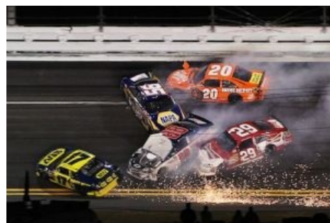
Сейчас отряхнутся и поедут дальше