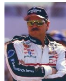
Дэйл Эрнхардт усат и пафосен

Дэйл Эрнхардт ( Устрашител ) — не менее почитаемый, чем Петти, гонщик. Прозвище заработал на почве выпиливания своих соперников, посредством работы бампером, за что был люто ненавидим ими и обожаем быдлом на трибунах. Спустя двадцать семь лет карьеры в NASCAR, семь чемпионских титулов, 76 побед, 22 поула и 677 гонок, был выпилен в Дейтоне в 2001-м взбесившимся (от столкновения со стеной) ремнем безопасности, убавшим его в открытом забрало шлема, так как Устрашител по традиции протестовал против всяких мер безопасности (типа закрытого шлема и системы HANS). Многие фанаты считают, что с его смертью закончился настоящий NASCAR и началась эра джиммиджонсонов. При жизни был усат . Дело папаша продолжил его сын (на самом деле два сына, но успехи Керри были максимально скромны и немногие его помнят).