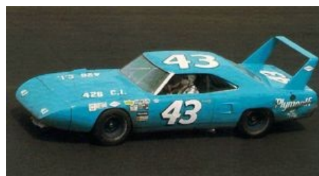
Plymouth Superbird во всей олдскульной красе