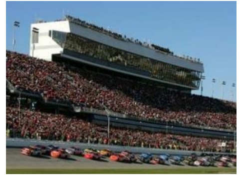
Снова Дейтона — главный супервал всего замута

Дейтона Интернейшенл Спидвей и Талладега Суперспидвей — суперспидвей, гордость и слава НАСКАРА, с которых началась его национальная слава. Первый был специально построен в 1959 году под нужды NASCAR. Гонка Дейтона 500 традиционно считается наиболее престижной в календаре NASCAR и для среднего американца по значимости стоит где-то на полступеньки ниже, чем финал суперкубка NFL. Помимо этого, Дейтона знаменита тем, что на ней за все годы проведения гонок NASCAR разбилось больше всего пилотов — 12. Включая упомянутого выше Эрнхардта.