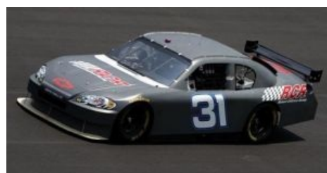
Сферический Car of Tomorrow в естественной среде обитания