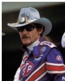
Каноничный Ричард Петти

Зрелого, успешного пилота NASCAR вы легко узнаете в толпе по его роскошным усам , которые, как известно, обладают магическими свойствами не только в автогонках, но и в порно- и шоу-бизнесе . Например: