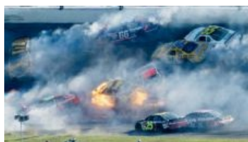
Сквозь дым Бородина

Весь смысл НАСКАРА заключается в его бессмысленности и беспощадности . Автомобили, якобы похожие на гражданские, на самом деле являются силуэт-прототипами с трубчатыми рамами, и серийных деталей в них даже меньше чем в DTM — по сути, это сваренные из труб клетки с установленными внутрь двигателем, трансмиссией, подвеской, сиденьем пилота и обклеенные рекламными щитами, пардон, кузовными панелями, якобы похожими на серийные. Так что употребление термина Stock в аббревиатуре, как ни крути, ЛПП . Также командам разрешается незначительно модифицировать кузов болида, который существует аж в 4 модификациях: для шорттреков (овалы до 1 мили), спидвеев (овалы больше 1