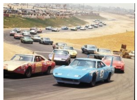
70'ые: тысячи их

В начале семидесятых нагрянул энергетический кризис. Эпоха маслкаров подошла к концу, и автогиганты предпочли уйти из NASCAR. В серии начался кризис. Лишь в начале восьмидесятых NASCAR начал подавать признаки жизни. Серия радикально изменила техническую политику. На старт теперь выходили сумрачные обмылки , напоминавшие серийные машины лишь наличием четырех колес, руля, да наклейки производителя на капоте. Технические инновации стали строго ограничиваться регламентом, дабы уравнивать всех Билли Бобов в шансах на победу. А главное — подоспел зомбоящик со своими прямыми трансляциями. Причем, начали ударно — первой же трансляцией стала Дейтона 500 79-го года, запомнившаяся битвой за победу между Кейлом Ярборо и Донни Аллисоном, а после схода обоих после краха незадолго до финиша их же махачем (к