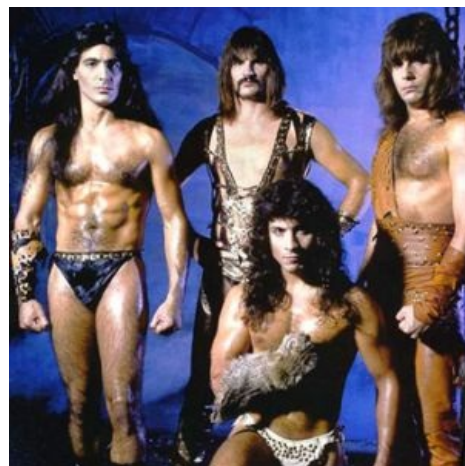
Каноничные меховые бронепанцу

Manowar (просторечн. «Самовар» или в более литературном переводе «Мыловар») — тру хеви-метал ВИА из Америки, при виде которого подготовленный зритель немедленно начинает шликать/фапать , а зритель без должной подготовки может обсраться от смеха. ВИА установил новые стандарты пафоса и громкости живых выступлений, а также задал новую нижнюю планку в области техничности игры на гитаре. Хотя, следует признать, в первой половине 80-х выпускали очень и очень годные альбомы. Считаются одними из столпов жанра. Укомплектован четырьмя крепко сбитыми патлатыми дядьками: вокалистом Эриком Адамсом, басистом Джоуи ДиМайо, гитаристом Карлом Логаном и ударником Скоттом Коламбусом (который уже посрался с Королями , свалил и внезапно, 5 апреля 2011 года, умер ). Музыка и тексты в основном сочиняет генератор псевдослучайных чисел ДиМайо. Название группы ДиМайо трактует как объединение понятий «война» и «жизнь», ибо жизнь с его точки зрения есть война. Алсо, Manowar или Man-o'-war — это вообще любой парусный (не весельный) военный корабль, как правило — действительно, крупный, например, трех- или даже четырехпалубный линейный корабль (и ВНЕЗАПНО медуза )