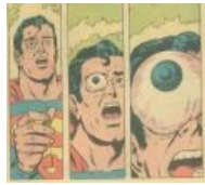
Too late! You've already seen it.