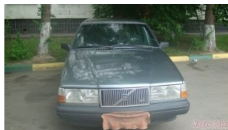
Он не знал, что есть Paint!

Тем не менее когда нужно быстро открыть графический файл, сделать минимум изменений (уменьшить масштаб, пририсовать красную загогулину — заострения внимания ради и т. д.), наплевав при этом на объём и качество — лучшей программы не найти.