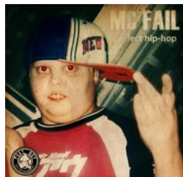
ЭмЦэ из говновидео.