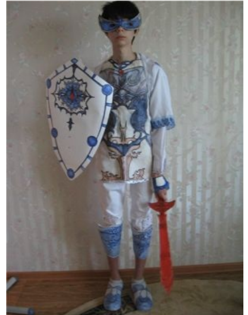
Представитель собственной персоной.