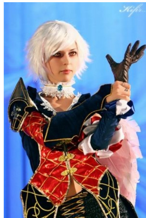
Хороший, годный косплей Kamael.