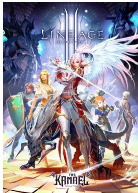
А вот постер и с камаэлькой в центре.