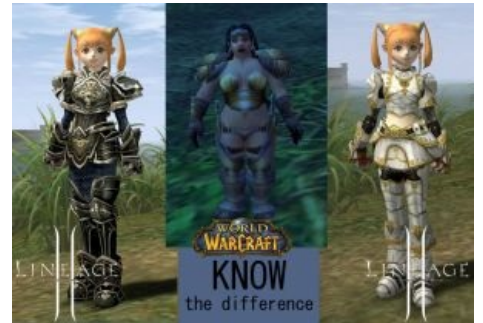
Сравнительный анализ дварфик из линейки и WoW .