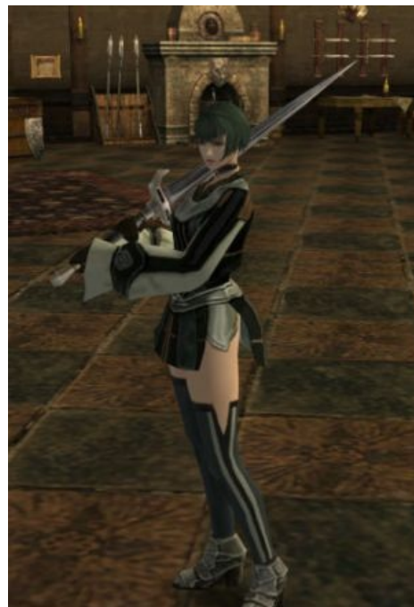
Девушка с веслом демонстрирует хрестоматийное зеттай рёйки .