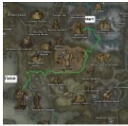
Рис. 1: Моб