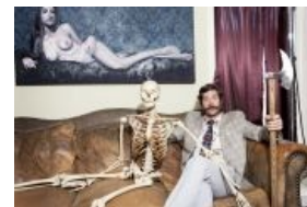
Уэс как художник