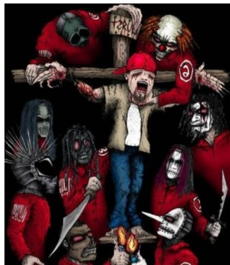
Мэгготы не прощают

В последующие годы сухари дали кучу концертов и даже завели собственные странички вконтакте .