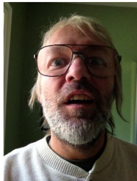
Федораст в облачении престарелого битарда смотрит на тебя как на своего фаната

рэпперский лейбл имени Лил Уэйна, выпустил пару треков с ним же, отрастил бороду и стал похож на Шуфутинского , однако, осознав это, вновь побрился. Впрочем, в июне 2014 года вновь защеголял со своей «летней» бородой. Политическая ориентация — профитизм : умудряется одновременно поддерживать Майдан , флюородросить Путену и хвалить клипы Brutto . Был женат три месяца на россиянке, ныне несколько лет женат на украинке, на родину которой ему въезд запрещён на 5 лет за постоянную задержку альбома. Fail.