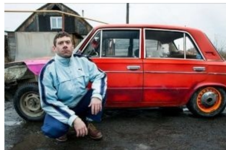
Борланд, жига и коза в настоящей России