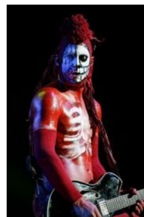
Уэс как он есть