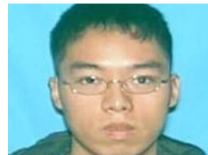
Чо Сынхи, автор 33 гета.

Killman (настоящее имя Чо Сынхи , кор. рас. , иерогл. , пинд. Cho Seung-Hui ) — расовый корейский рэмбо, герой и обычный педик , взявший 32 флага, не считая себя, и чуть более, чем 25 раненых, в Вирджинском политехническом институте (англ. Virginia Tech University ) в США в апреле 2007 года, по совместительству автор охуительных сценариев ( Are you a bisexual psycho rapist murderer! Please stop following me. Don't kill me! ).