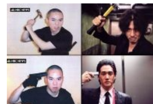
Притянутые за уши сходства

В послании, которое Чо Сын Хи отправил на телеканал NBC, есть его фотографии, имеющие много общего с кадрами из означенного фильма. Например, в послании есть фото Чо, где он запечатлен с занесенным молотком в руке, а также с приставленным к голове пистолетом.