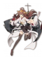
Линейный крейсер Конго. Построена в Англии, акцент и манеры соответствующие