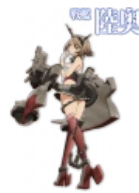
Линкор Муцу в игре...