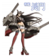
Нагато. Нет, не та, а линкор.