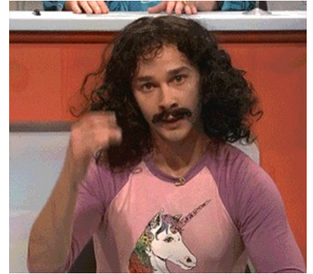
Шайа Лабаф показывает

Поэтому, ежели вам кажется, что изображения на этой странице статичны, необходимо установить расширение APNG для Opera (после .15) или Google Chrome . Только Firefox и его надстройки поддерживают APNG без дополнительных расширений. А ослоёбы сосут!