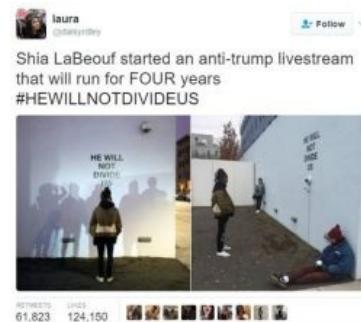
Как всё началось

he will not divide us BEST TROLL MOMENTS ★ Дайджест