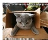
Кот в Мексике! А сначала не понял