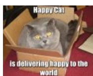
Он доставляет счастье