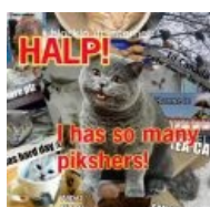
«Помогите! Так много фоток со мной!»