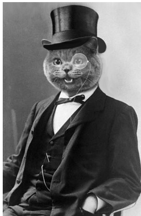
Грубый, но счастливый