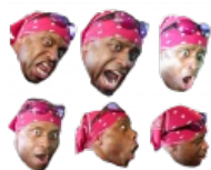
Oh, happy negroitable!