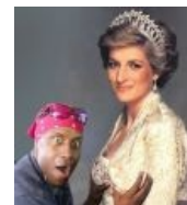
Happy Negro & Lady D