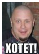
Happy Russian Edition