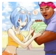
Happy Rei и арбуз Happy Shining