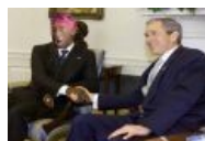
В гостях у 43-го