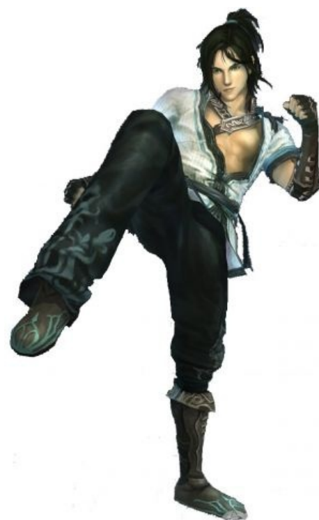
Местный Чак Норрис