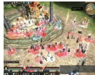
Колониальная война в разгаре. На заднем плане — гигантский боевой голем

мободроча в ГЭ заставляли содрогнуться даже бывалых «лянщиков» (после сотого уровня задротность резко возводится в гиперкубическую степень), как следствие — любые игроки любых гильдий, которые хотя бы пытались бороться за место под солнцем, круглосуточно фармили ботами. Администрация раз в полгода устраивала охоту на ведьм и, по слухам, разбивала за реал. Знающие камрады утверждали , что на некоторых иностранных серверах боты легализованы.