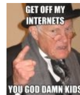
Съебите с моих интернетов, дети. А вот в мои-то времена...