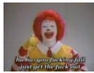
RonaldMc: GTFO U