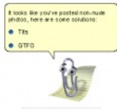
TITS or GTFO