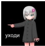
LOLI HAET U, GOU OWEI