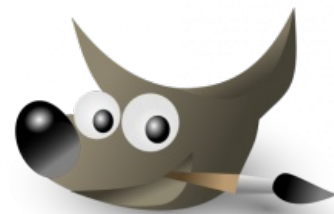
Логотип — гёвно-с-глазами койот Уилбер с кисточкой в зубах

Поскольку известная контора не спешит выпускать фотошоп под православную ОС Линупс , то одна из обязательных тем любого холивара на тему « Линупс vs Венда » — почему GIMP хуже лучше Фотошопа. При этом стоит заметить, что gimp давно уже собирают и под винду , а Photoshop запускается и вполне себе успешно работает в wine (даже свежий CS6, гуглить Photoshop_Portable_13.0_Multilingual.paf.exe , запускать через PlayOnLinux в wine 1.7.20-PhotoshopBrushes с нативной atmlib.dll ).