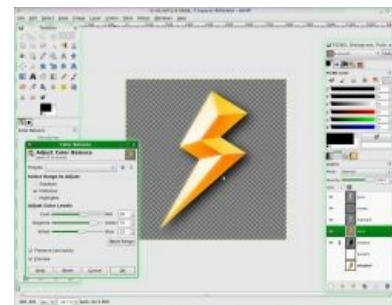
Он же, в естественной среде обитания