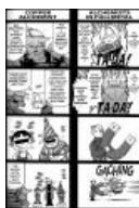
Отрывок из четырёхпанельного комикса, являющегося ОВАй ко второму сезону