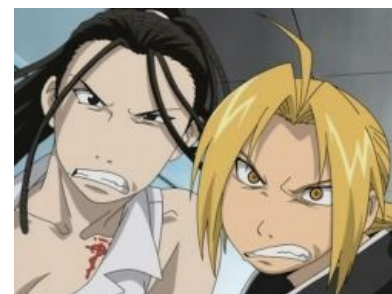
Главге-й и его сенсей.