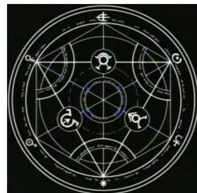
Круг Трансмутации. Сейчас определён что-то будет...