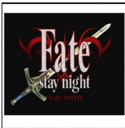
What I Watched