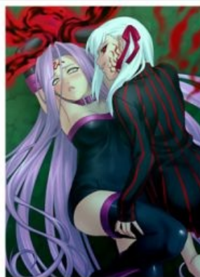
What I Expected