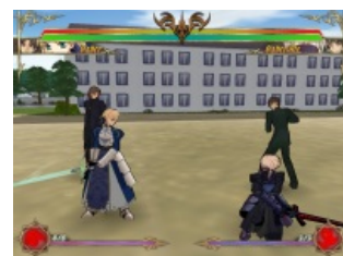
Сейбер из игры «CRUCIS Fatal Fake»

Игра доставляет большим количеством неочевидно открываемого материала . Имеется комбобрейкер . От других файтингов игра отличается тем, что позволяет менять озвучку игры. На выбор голос любого героя из онэме и добавленных. Можно фапать на голоса кавайных лолли . Доставляют ЛИЧНЫЕ диалоги до/после боя, то есть не простые я тебя замочу/размажу/ты хуй, а вполне себе личные обращения к оппоненту.