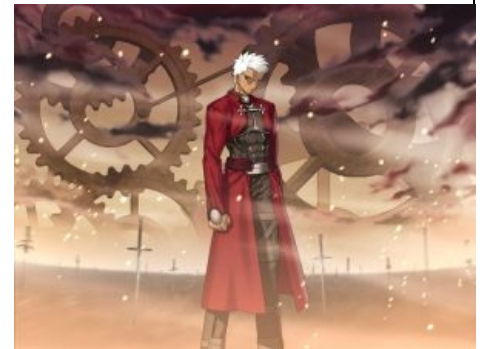
Во всей своей красе

1C 3dfx A challenger appears Action 52 Aion Alignment All your base are belong to us Angry Birds Angry Video Game Nerd Another World Arcanum Assassin's Creed Baldur's Gate Barrens chat BASKA Battletoads Beat 'em up BioWare Bitches and whores Blizzard Blood Brick Game Bridget Carmageddon Chris-chan Civilization Combats.ru Command & Conquer Company of Heroes 2 Contra Copyright Corovaneer Online Counter-Strike Crimsonland Crysis Daggerfall Dance Dance Revolution Dangerous Dave Dark Souls Dead Space Demonophobia Denuvo Deus Ex Diablo Did he drop any good loot? Digger Disciples Doki Doki Literature Club! Doom DOOM: Repercussions of Evil Dopefish DotA Dreamcast Duke Nukem 3D Dune 2 Dungeon Keeper Dungeons and Dragons Dwarf Fortress Earthworm Jim Elasto Mania Elite EVE Online Everquest 2 F-19 Falcon Punch Fallout Fate/stay night Five Nights at Freddy's Flashback FPS GAME OVER Game.exe GameDev.ru GamerSuper Garry's Mod Giant Enemy Crab GoHa.Ru Gothic Granado Espada Grand Theft Auto Guilty Gear Guitar Hero Half-Life Half-life.ru Heroes of Might and Magic Hit-and-run Hitman HL Boom Homeworld I.M. Meen Ice-Pick Lodge IDDQD Immolate Improved! It's dangerous to go alone! Take this. Itpedia Jagged Alliance Kantai Collection Katawa Shoujo Kerbal Space Program Killer Instinct