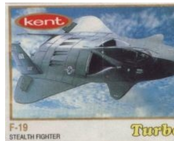
Вкладыш от жвачки Turbo

Каждый труь олдфаг свято помнит легендарный клюквенный 3D симулятор F-19 Stealth Fighter , в этой стране устанавливаемый в качестве обязательного ПО. Создан он был еще в лохматом 1988 году. Разработчик — Сид Мейер [2] . С помощью незабываемого радара ПВО в Триполи, на него как бы намекает нам Пелевин в своём «Принце Госплана». Разработчики из Microprose уверяют, что к ним приходили вояки из Пентагона и пугали анальными карами за разглашение военной тайны. В результате, более трушную версию игры власти скрывают!