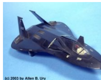
Игрушечный F-19 as is