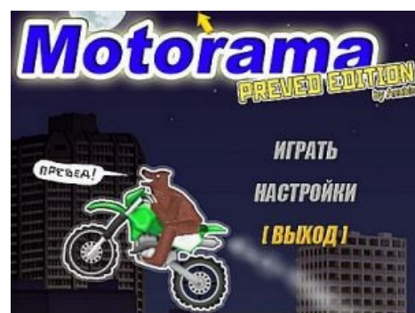
Motorama preved edition