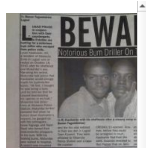
Та самая статья

Однако настоящая популярность мемеса пришла лишь в январе 2019 года. В частности, 16 января была залита подборка самых вкусных моментов интервью.