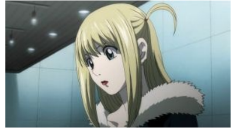
Миса-Миса — гламурная киса