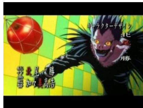
Приманка для Рюука

https://www.youtube.com/watch?v=LNB1DtdR_NI От Death Note умирают дети