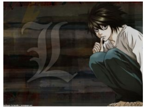
L. (Eru, desu.)