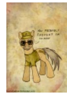
А вы думали, я человек?