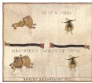
Будет вам, аз есмь лишь Чакъ Теста.