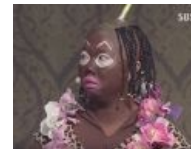
Азиаты знают толк в жирном троллинге