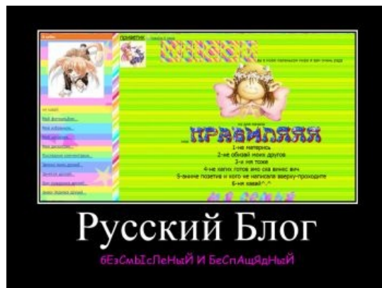
Русский блог с кошерным шрифтом DS Sholom

95% дневников на Беоне раскрашены в кислотно-инфернальные цвета и снабжены мигающей анимацией где попало, при виде чего