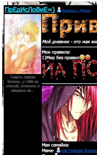
Сферический ебонщик в вакууме. Обратите внимание на ссылку снизу.

Вообще. Я больше не знаю что сюда откликать =|