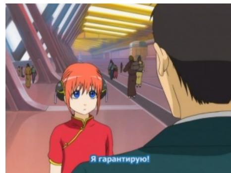
Gintama Кагура гарантирует!