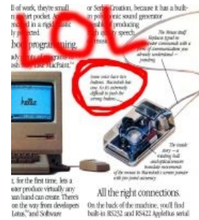
Эппл не стеснялась намекать на низкий интеллект своих пользователей.