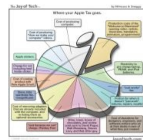
За что платит покупатель.