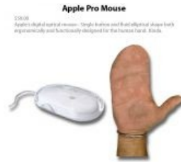
Правда о яблочной мыши.