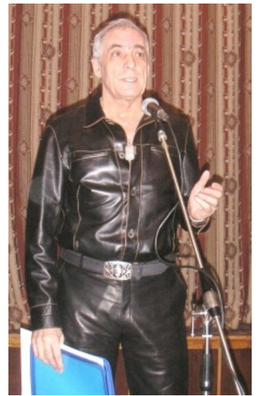
ЮАН в кожаном прикиде