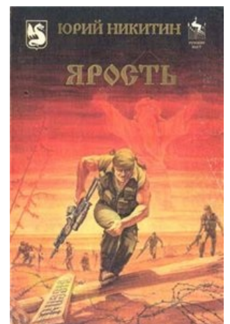
Степанка Обложка Ярости

Диалогия Имаго/Имортист. Сюжет: какие-то стосковавшиеся по ФГМ задроты решили основать новую религию, повернутую на бессмертии, и в конце концов пришли-таки к власти и построили свой рейх с блэкджеком и шлюхами. Так как представления автора о политике, управлении государством и прочих скучных материях весьма расплывчаты, эти моменты Никитин в своих книгах стыдливо обошел. Чуть более, чем все 400—500 страниц каждого из романов главный герой в компании сперва друзей, а потом и соратников по партии, рассуждает о падении нравов, засилье толерастии и цугундере, до которого доведен русский народ-богоносец. Главный герой, как и во всех прочих романах, является альтер эго автора, зарабатывает денюжку, пописывая и отсылая заказчикам через интернет политические прогнозы, а помимо этого тайно пишет некое Произведение, призванное перевернуть мир. Надо ли говорить, что героем автор любит, видя в нем того человека, которым никогда не станет сам? Алсо, в первой книге русскую девушку опять-таки ебут нигры, спустя положенный срок она рождает негритенку, но, начитавшись Тезисов об Имортизме, производит утопление «сына оккупантов» в ванной своей малогабаритной квартирке. Полностью заимствовано у Сомерсета Моэма, рассказ «Непокоренная».