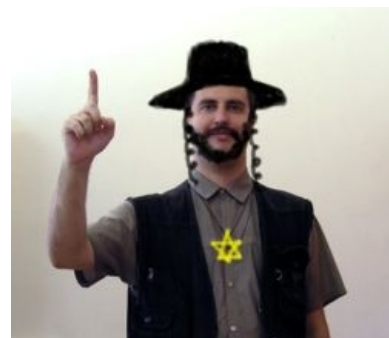
На фоне Мухина даже Мицгол выглядит как последний сионист.