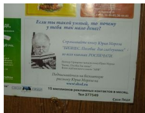
Адепты ИЮМ в Саратове