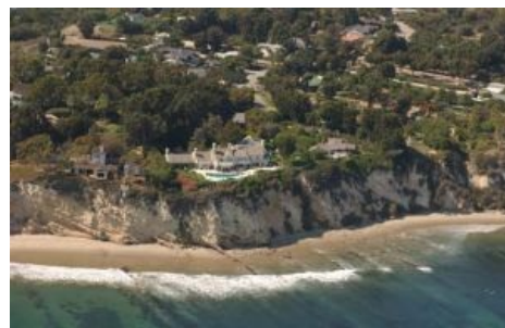
Та самая фотография

Сей феномен обязан своим названием одной из пострадавших от него — небезызвестной ЕРЖ Барбре Стрейзанд , когда её дом оказался на одной из фотографий побережья в Калифорнии. То есть — фотограф делал фото береговой линии Калифорнии, ничего личного. Барбра подала на фотографа в суд и потребовала убрать неудобную фотографию. Однако об этом прознал анонимус, и фотография очень быстро расплозлась по окружающим интернетам так, что эта задача стала гораздо более сложной, чем задача овладения телом самой Барбры рядовым битардом .