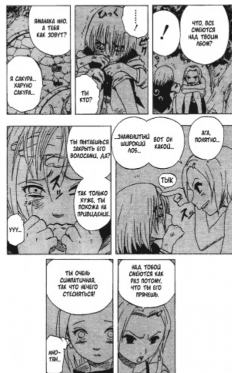
Даже любимая манга не

Многие ошибочно думают, что люди с АГП такое отношение могут провоцировать специально, в целях пиара. Но подобная слава навязывает и определённое отношение — например, Мицгол хотел стать проповедником духовности, а стал клоуном . И никто к его идеям уже не относится серьёзно. Так что, несмотря на тщеславие