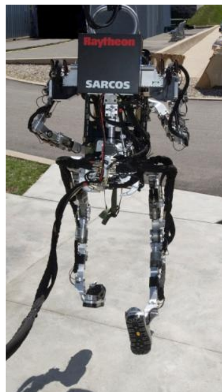
Первый годный прототип сбежал из лаборатории. FAIL!