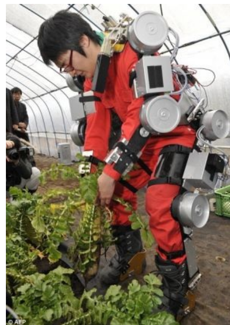
Простой японский крестьянин

"Хёндай" корейский придумал проще: сделать агрегат, всё время поднимающий руки вверх (чтобы на конвейере работать под днищем новых авто) и назвал сей грязный хак рук "экзоскелетом".