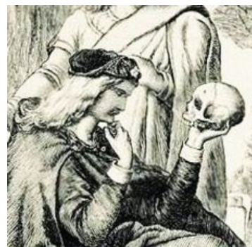
Экзистенциальный кризис. Эталон из палаты мер и весов