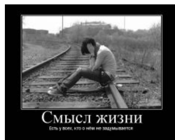
На самом деле

The Young Dads - Existential Crisis Песня