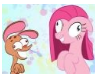
Два психа встретились