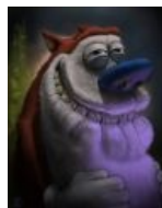
Стимпи в 3D