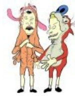
Бивис и Баттхед