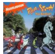
Ничего не напоминает?