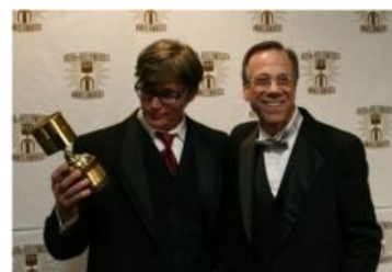
Джон Крисфалуси (слева) получает награду Уинзора Маккея за воистину КАЧЕСТВЕННУЮ анимацию

В этом мультсериале показан какой-то совершенно другой, не похожий на наш, мир. Он наполнен психами, шизофренией, деструктивностью, насилием. Здесь реальны океаны из сосисок; черные дыры, проходя через которые, попадаешь в место, куда попадают все левые старые носки;