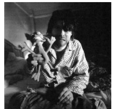
Курт Кобейн «любит» Рена и Стимпи