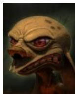
Рен в 3D