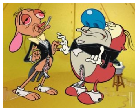
Рен и Стимпи, собственными персонами

«Шоу Рена и Стимпи» (англ. The Ren & Stimpy Show ) — провокационный, пожалуй, самый отвязный мультсериал, что крутили по каналу Nickelodeon, а также по «2x2», ТНТ, РЕН ТВ и MTV. Сюжеты всех серий с участием безбашенных зверушек, чихуахуа Рена и кота Стимпи, неразрывно связаны с такими животрепещущими темами, как говно , секс и всякого рода извращения, которые в анимированной индустрии обычно показывать моветон. Безумная пародия на классические детские мультики, ориентированная прежде всего на копрофильствующих эстетов и медленно сходящих с ума психов с извращённым разумом. Сериал является плодом борьбы его художника-аниматора Джона Крисфалуси против устоявшихся стандартов традиционной мультипликации а-ля Дисней, в которой, по его собственному признанию, «всё очень красиво и классно, только слишком прилизанно и редко когда смешно». Это один из самых странных сериалов. Также отличается отличным качеством рисовки. Он наполнен сюрреализмом, паранойей и ВНЕЗАПНО классической музыкой. Автор никогда не принимал вещств .