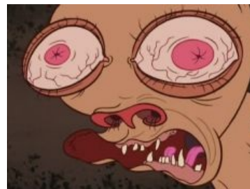
Рен смотрит как-то удивлённо