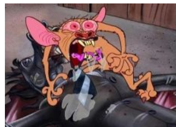
Рен в своём естественном состоянии

великаны, которые хотят, чтоб им побрили язык; семья, которая живет в мертвом ките; горящий газ Вонючка, который женится на тухлой рыбе... Примерный сюжет обычен для многих мультиков — два зверька периодически влипают в разные ситуации, но, как уже было сказано, упоротость ситуаций заметно выше. Герои то попадают на другую планету, то пытаются стянуть тарелку со свиными шкварками, то батрачат на двух безумных фермеров, то Рен становится отшельником и уходит жить в пещеру, устав от городской жизни, то Стимпи ищет своего друга Вонючку, etc. Буквально в каждой серии присутствуют шикарные второстепенные персонажи, шизоидный юмор и уникальные ситуации.